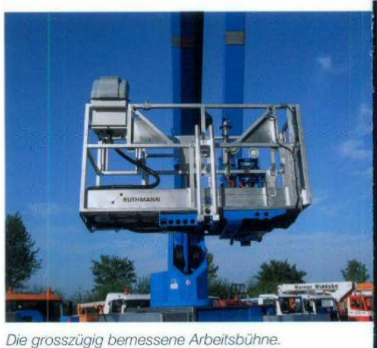
Die grosszügig bemessene Arbeitsbühne.

Mit einer seitlichen Reichweite von über 40 Metern und einer Arbeitshöhe von über 58 Metern ist die neue Ruthmann-Steiger-T-580 die bisher leistungsfähigste Arbeitsbühne der Welt. Ihr Debüt gab sie am 20. Februar 2009 vor der von Hundertwasser entworfenen Markthalle in Altenrhein SG.