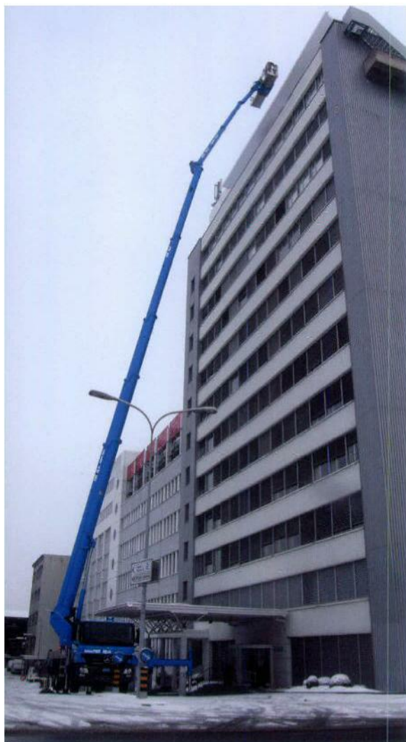
Die neue Ruthmann-Steiger-T-580, hier bei einem Einsatz an einem Hochhaus. Mit einer maximalen Arbeitshöhe von 58 Metern und einer Reichweite von 40 Metern kommt sie fast überall hin.