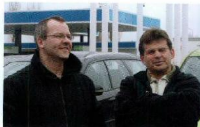
Links: Werner Herzog, Pronto Reinigung.