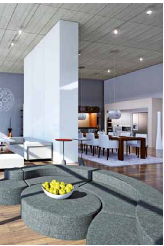
Repräsentative Laden- und Geschäftsräume