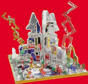
Kunstwerk «Bunter Zoo» von Schule Bethlehemacker, Bern