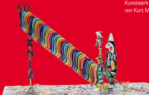
Kunstwerk «50 mal Knie hoch» von Peter Leiggenger, Visp