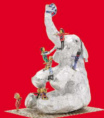
Kunstwerk «Kinderelefant» von Monika Rutschi, Fällanden