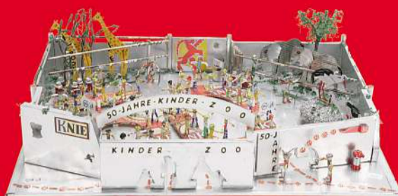
Kunstwerk «50-Chind im Chinderzoo-Rappi» von René Mäder, Zürich

Die Gewinnerinnen und Gewinner des Alu-Kreativ-Wettbewerbs sind bereits schriftlich benachrichtigt worden.