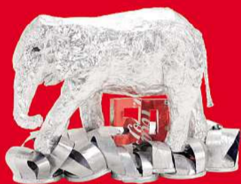
Kunstwerk «Elefantastische 50 Jahre» von Franziska Schüpbach, Wasen im Emmental