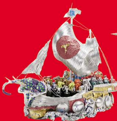
Kunstwerk «Glückwunschschiiff 2012» von Kurt Meister, Kirchberg BE